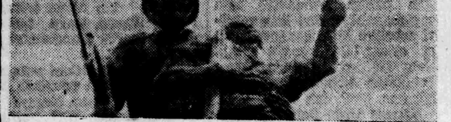
Jan Hari Pahlawan tahun ini di Ibukota...